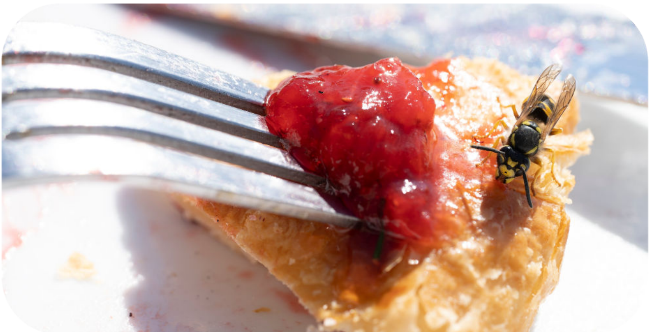
Eine Wespe auf dem Kuchen? Erstmal: Ruhe bewahren!