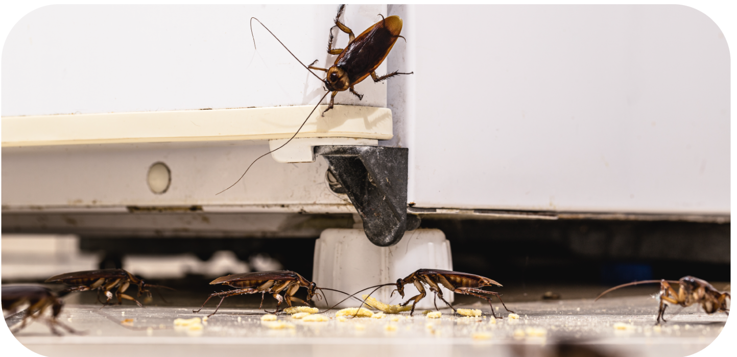
Lebensmittelreste hinter dem Kühlschrank? Ein gefundenes Fressen für Kakerlaken.

Du bist neugierig, welche das sind? Auf den nächsten Seiten wirst du fündig.