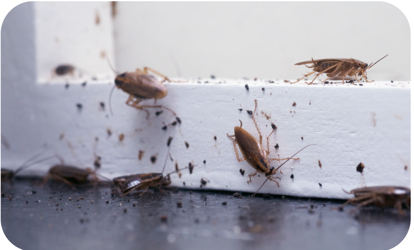
Ein Anzeichen für Kakerlaken: Dunkle Kotspuren an Wänden und Böden, die an Kaffeekörner erinnern.

Ein Schabenbefall kann zu einem handfesten Problem werden, denn die Schädlinge sind extrem robust und vermehren sich massenhaft. Die gute Nachricht: Ist das Kakerlakenproblem identifiziert, lässt es sich mit ein paar Tricks, den richtigen Mitteln und etwas Geduld in der Regel gut in den Griff bekommen.