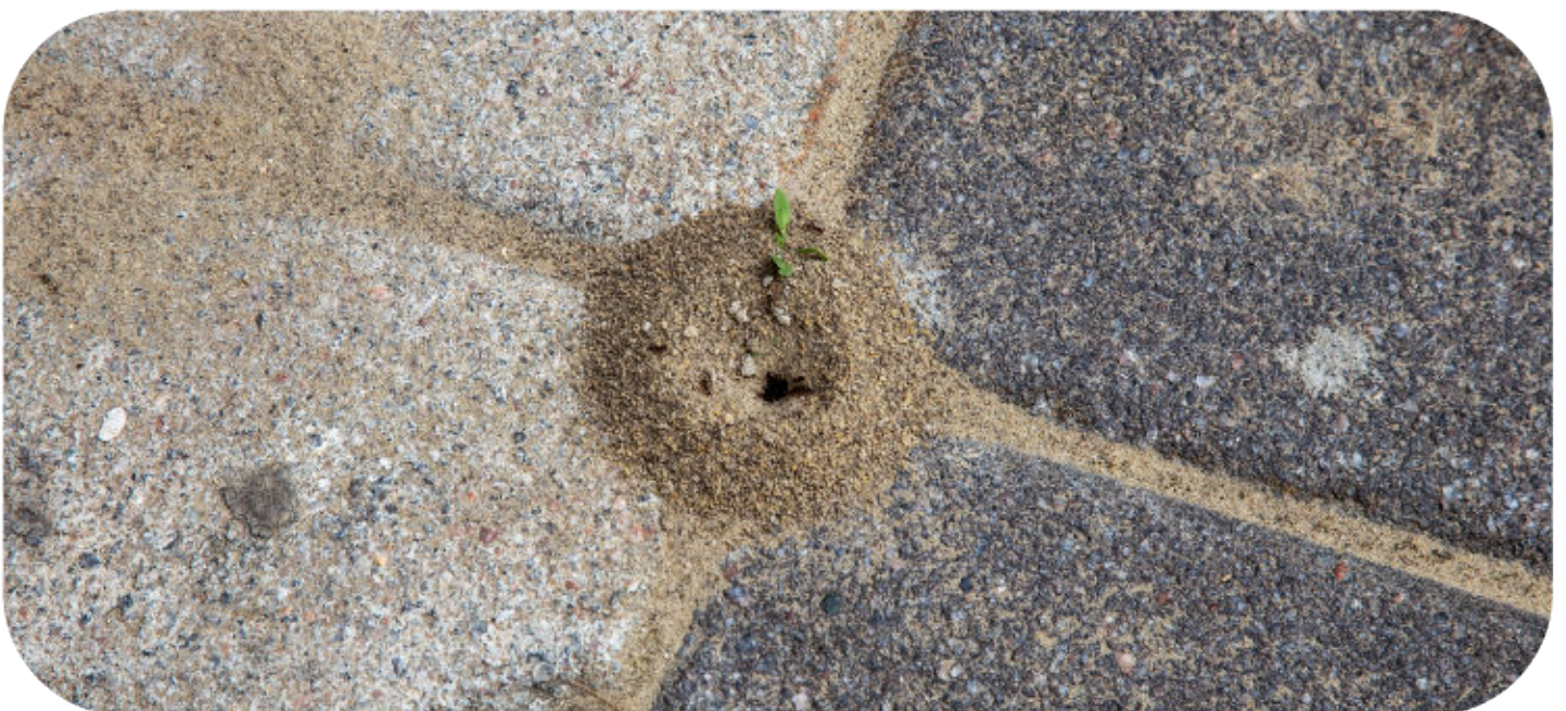
Ameisen werden von offenen Lebensmitteln angelockt

Diese Hausmittel können temporär helfen, den Ameisenbefall zu reduzieren, lösen das Problem aber nicht vollständig. Für eine langfristige Lösung ist es notwendig, die Königin und die gesamte Kolonie effektiv zu bekämpfen.