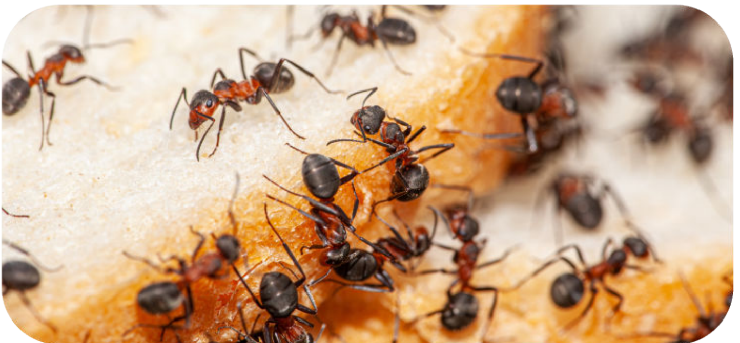
Ameisen werden von offenen Lebensmitteln angelockt